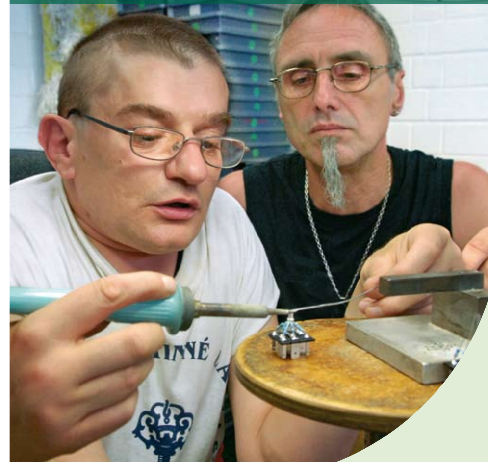
Werkstatt IV, Bergiusstraße

Wir haben Vertrauen in die Fähigkeiten von Menschen mit Behinderung.